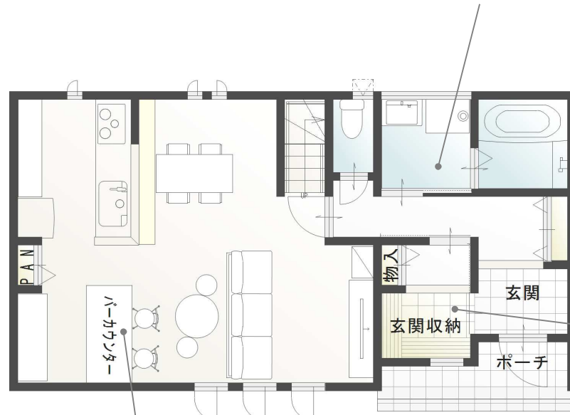
PLAN VIEW 1F

住まいにおいて第二の主役ともいべき水回りは 頻繁に利用する場所として機能性や効率性だけでなく プライバシーにも考慮して計画しました。