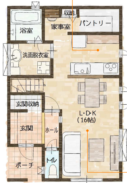
Plan View 1f

2階子供部屋へ行き来する時も家族と顔併せるので、いつもお子様の様子を確かめることができます。また、キッチンのそばにパントリー、家事室、洗面脱衣室があるので短い動線で家事をこなす事ができます。