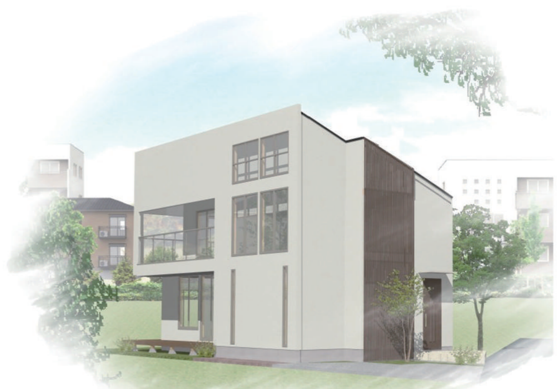
— 2 階 —

可動間仕切り 子どもの成長に合わせて部屋づくり。 子どもが小さいうちは、広めの1部屋で一緒に寝たり遊んだり学んだり・・・将来的には間仕切り個室にして、使うことができ、子どもの成長に合わせた部屋にすることができます。