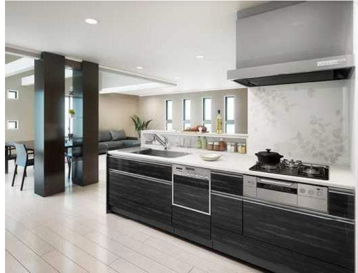
オフエアプラン例 コンフォートモダン