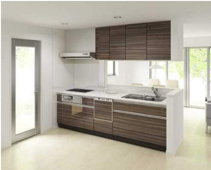
オフエアプラン例 お掃除も調理も早くできる家事楽キッチン。