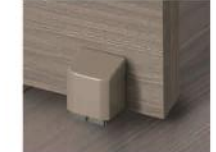
シャインニッケル