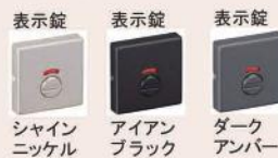
表示錠 シャイン ニッケル 表示錠 アイアン ブラック 表示錠 ダーク アンバー